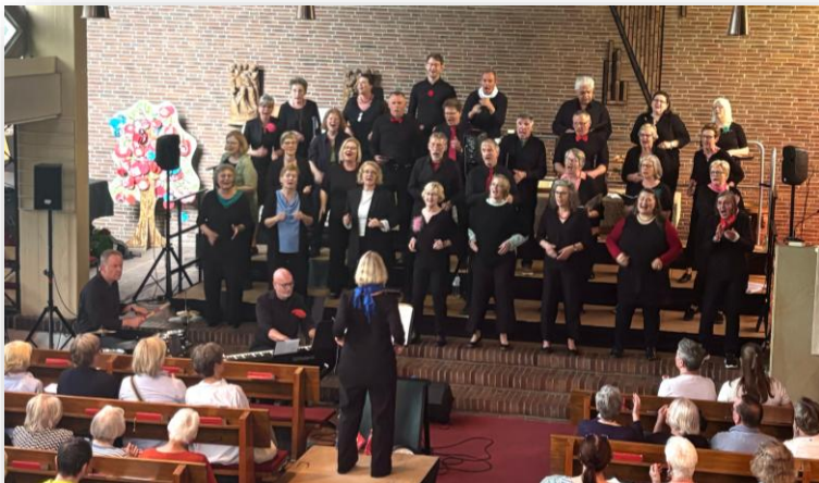
Text und Bild: B.Sivers