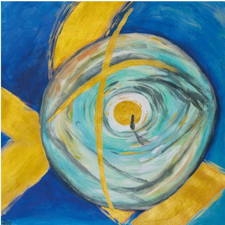
Acrylmalerei von Doris Hopf © Gemeindebriefdruckerei.de