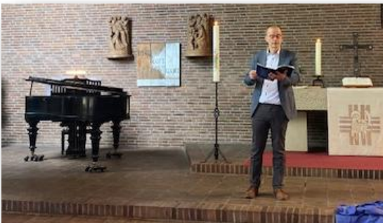
Text und Bild: A.Eiffert