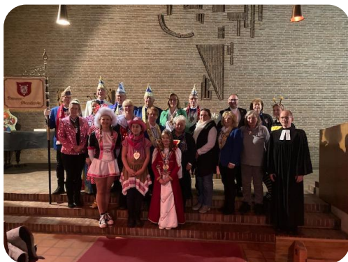
Text und Bild: A. Eiffert

Pastor Vocka benannte nicht nur die heutigen Fastenarten, wie den Verzicht auf Genussmittel oder die Themen der Aktion „7 Wochen ohne“ (dieses Jahr sollten es „7 Wochen ohne Härte“ sein). Sein Thema war, dass das Fasten uns die Möglichkeit einer engeren Verbindung zu Gott ermöglichen soll, durch innere Einkehr und Besinnung auf das Wesentliche. In diesem Sinne ein dreifaches Moorrege-ahoi!