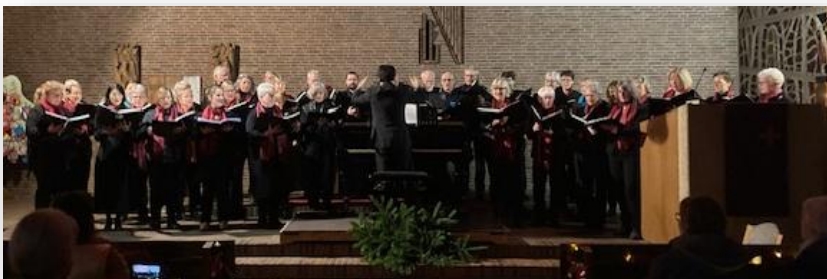
Text und Bild: A.Eiffert

Wir danken allen Beteiligten für diese tollen Konzerte und hoffen auf ein Wiedersehen im diesjährigen Advent.