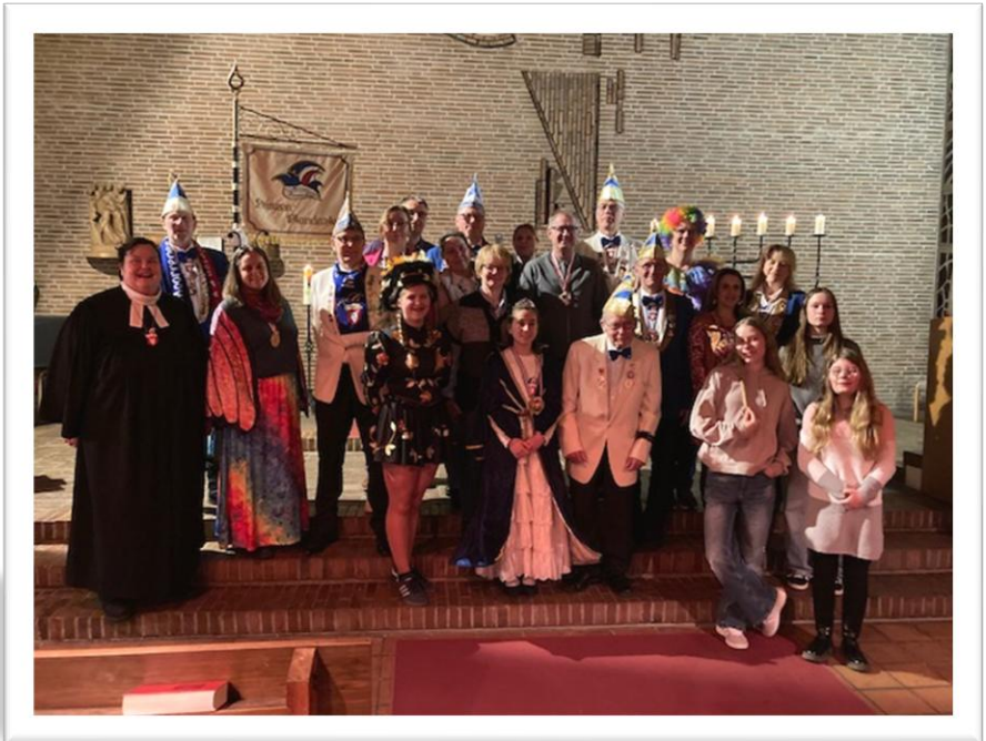
Text und Bild: Anja Eiffert

Mit dem Kreuz aus Taufwasser auf die Hand gemalt erhielt jeder seinen persönlichen Segen zum Start in die Passionszeit.