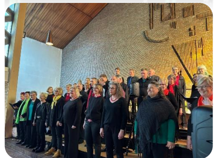
Text und Bild: Voice&Spirit